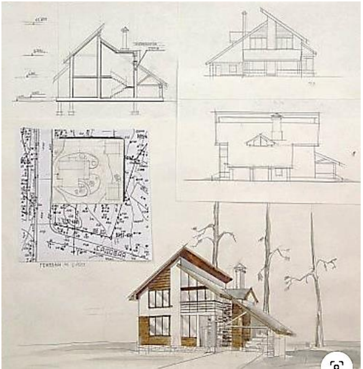
Рис.3. Приклад № 3