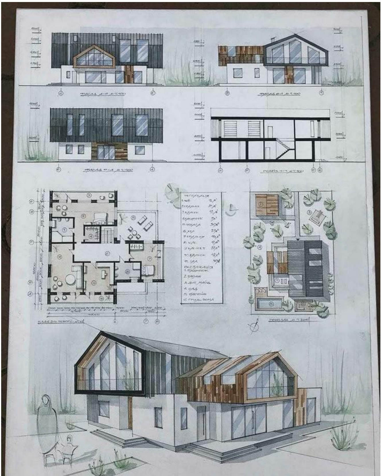
Рис.2. Приклад № 2