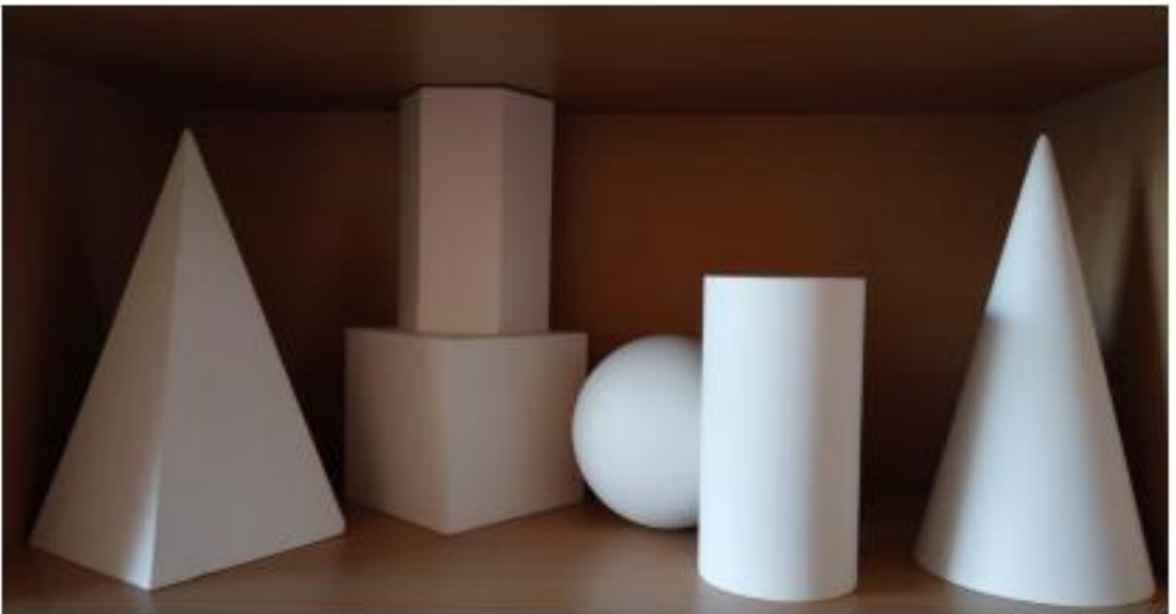
Рис.1. Гіпсові фігури

Перелік фігур можна подивитися на рис.1.