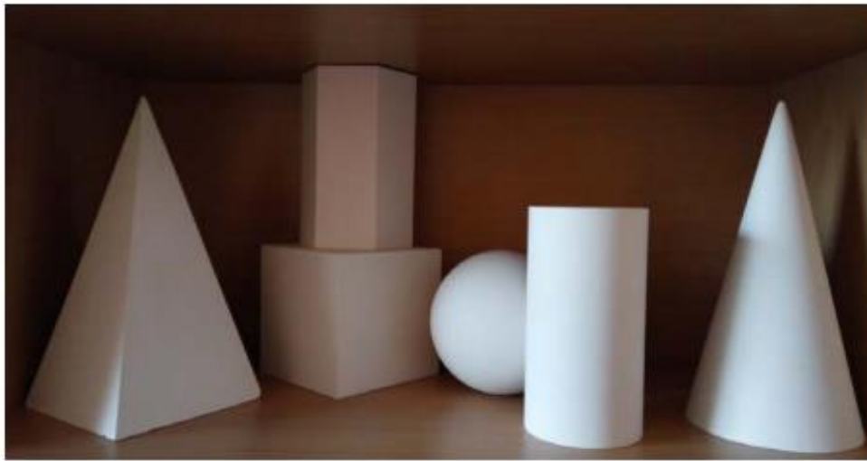
Рис.1. Гіпсові фігури

Вступне випробування (творчий конкурс) – це виконання графічного завдання, що передбачає виявлення здатності вступника до створення в уяві та відображення на папері композиції із заданих геометричних фігур. Перелік фігур можна подивитися на рис.1.